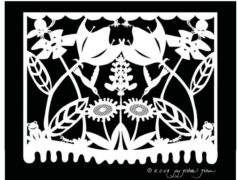
Diario del tiempo

¡Bibliotecas: En lo más profundo del corazón de Tejas!